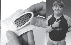
Bambini: in prossimità del pene